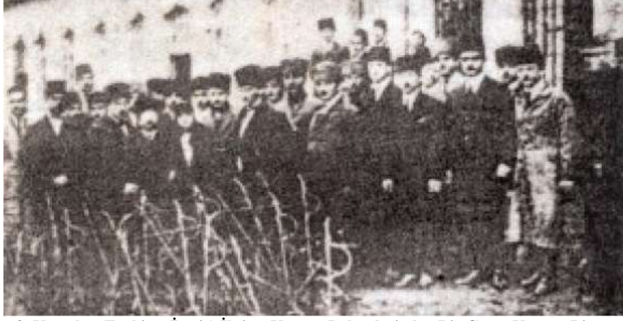
Resim 5: Gazi Mustafa Kemal ve Türkiye (İzmir) İktisat Kongre Delegelerinden Bir Grup, Kongre Binası önünde, 27 Şubat – 4 Mart 1923

farklı şeylerdir. İşte, mevzunun bam teli de budur. Hatta “Lozan kesildiği için kongre toplandı” iddiasının tam tersine, İktisat Kongresi’nin, “barıştan sonra” toplanmasının tasarlandığını ileri sürmek bile olanaklıdır. Çünkü barış konferansının kesilmesi bir yana, bu kadar uzun sürmesi bile taraflarca beklenmeyen bir durumdur.