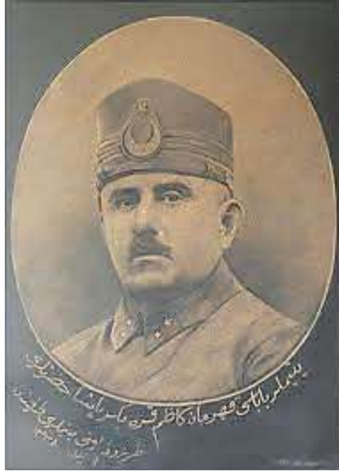
Resim 7: Kazım Karabekir