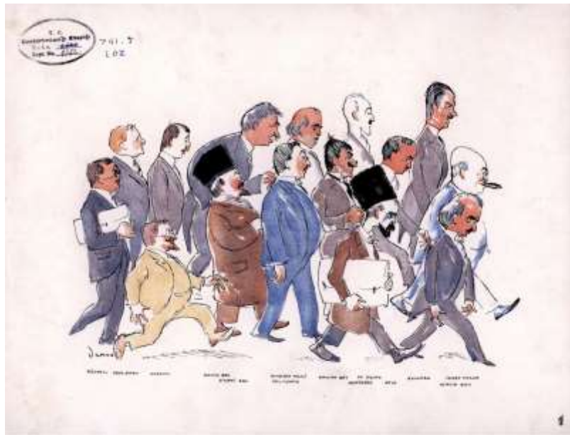
Resim 4: Derso ve Kelin'in çizgileriyle Lozan'da Türk Heyeti

Aynı günlerde Lozan'da bulunan İsmet İnönü başkanlığındaki Türk delegasyonu ise özellikle kapitülasyonların kaldırılması ve iktisadi bağımsızlık için gerilimli bir uğraş vermektedir. Ankara Hükümeti'nin önüne Osmanlı dönemine ait 300 – 400 yıllık hesaplar çıkarılınca da uzlaşma sağlanamamış ve görüşmeler, Gazi'nin bilgisi dâhilinde, 4 Şubat 1923 tarihinde Ankara'nın kendisine dayatılan anlaşma hükümlerini reddetmesi üzerine kesintiye uğramıştır.