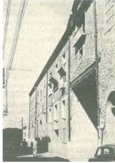
Resim 3: Kongrenin Yapıldığı Hamparsumyan Han, 1974 yılı dış görünüş