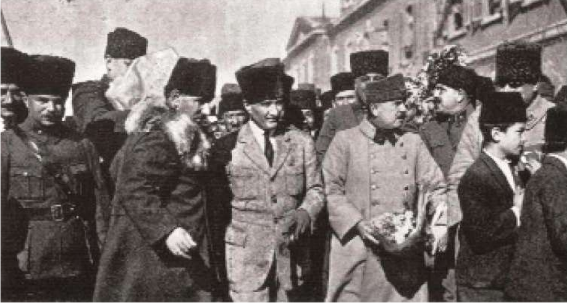
Resim 6: Gazi Mustafa Kemal ve Kazım Karabekir Paşa'nın Kongre için geldikleri İzmir Basmahane Garında karşılanışları

programımızda, gerek ilk tahsilde, gerek orta öğretimde; verilecek bütün bilgiler, bu görüşe uygun olmalıdır. Maarif programlarımız böyle düzenlenince, devletin diğer şubeleri için düşünülecek programlar da ekonomi programına dayanmaktan kendilerini kurtaramazlar. Esaslı bir program yaparak, bunun üzerinde, bütün milleti aynı uygunluk içinde yetiştirmek ve eğitmek gerekmektedir”