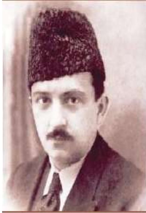
Resim 8: Mahmut Esat Bozkurt

Buraya dikkat isterim; bu sözlerin sahibine ırkçı ve faşist diyenlerin yüzleri hiç kızarmaz mı?