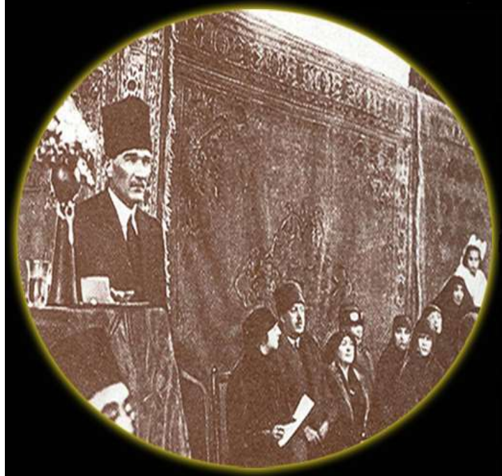
Resim 1: Gazi Mustafa Kemal, Türkiye (İzmir) İktisat Kongresi için gittiği İzmir'de Kongreden bir gün önce İzmirli hanımlarla toplantı yapmıştır, 16 Şubat 1923

Bu yazı, Birinci ii İzmir İktisat Kongresi'ne dair kimi izleri sürerek hatırlatmalarda bulunmayı ve günümüze ışık tutmayı amaçlamaktadır. İzler esas olarak başkumandan Gazi Paşa'nın Kongreyi açarken yaptığı oldukça ayrıntılı ve çok önemli konuşmasının kurgusu doğrultusunda olacaktır iii .